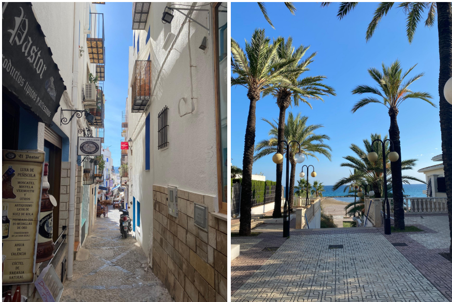
(links Peñíscola, rechts Benicassim)

An den Wochenenden sind wir nach Valencia gefahren (ca. eine Stunde mit dem Zug), an den Strand gefahren (ca. 30 min mit der Tram) oder ins Kino gegangen. Benicassim ist ein Ort in der Nähe mit einem wirklich schönen Strand. Auch Peñíscola und Chulilla empfehle ich sehr. Diese Orte eignen sich gut für Tagesausflüge. Hier gibt es unter anderem Angebote von der Agentur SoyEramus - Achtung! Diese waren oft sehr schlecht organisiert und zum Teil dadurch auch gefährlich. Es ist besser, sich an die ESN Gruppe von der UJI zu halten oder die Trips selbst zu planen. Im Frühjahr findet in Castellón die Magdalena statt. In Valencia werden die Fallas gefeiert. Beide Feste sind wirklich interessant und es lohnt sich, beides zu besuchen.