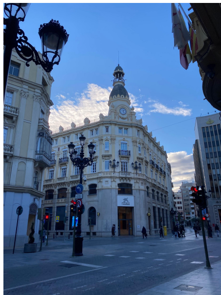
(Zentrum von Castellón)

Einen Tipp möchte ich bezüglich der Finanzierung geben: Es ist dringend notwendig, ein finanzielles Polster anzulegen. In meinem Fall habe ich erst nach einem Monat die erste Erasmus-Rate erhalten und auf mein Geld vom Auslandsbafög warte ich noch immer (und ich bin seit fast einem Monat schon wieder in Deutschland). Es kommen im Ausland noch viele zusätzliche Kosten auf einen zu, wofür das Erasmusgeld schlicht und ergreifend nicht ausreicht. Die WGs sind oft nicht gut ausgestattet und fast alle Erasmus-Studierende mussten sich z.B. Ventilatoren, dickere Bettdecken, Haushaltsgegenstände/-Utensilien kaufen. Zudem kosten viele Aktivitäten Geld und um andere Erasmus-Studierende kennenlernen zu können, ist es wichtig, an diesen teilzunehmen.