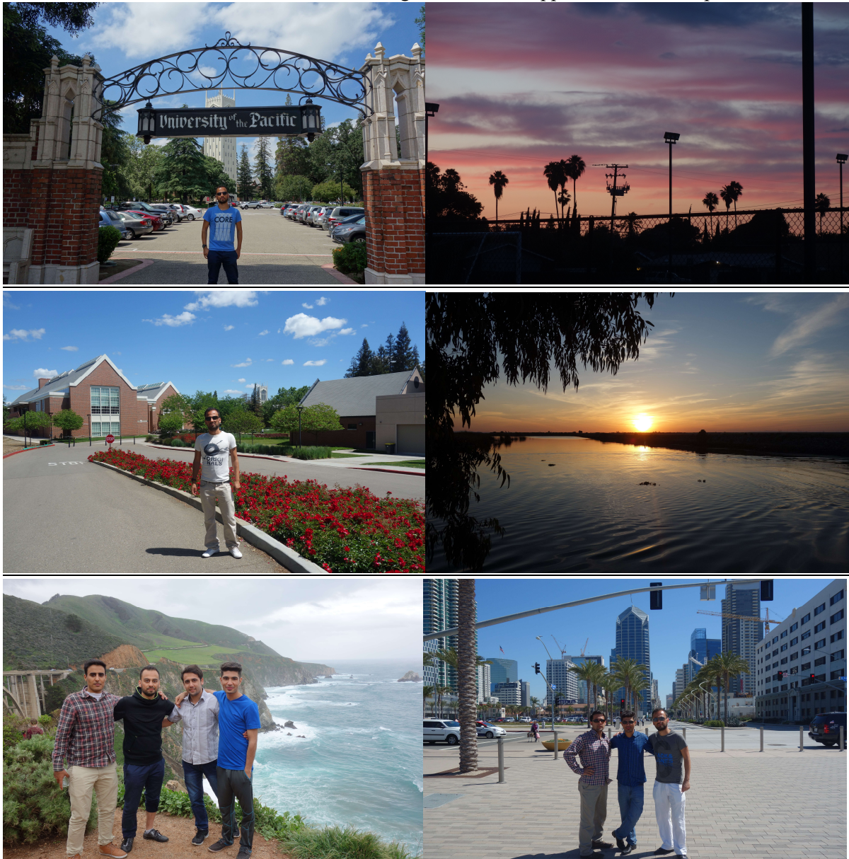
1. Eingang UOP 2. Blick vom Wohnkomplex Monagan Hall 3. Blick auf UC 4. Paradise Point Marina 5. Spring Break Tour (Bixby Creek Bridge) 6. Spring Break Tour (San Diego)

Das sind die festen Ausgaben die euch schon vor der Reise erwarten. Dazu würden euch dann weitere Kosten, je nach eurem Lebensstil und extra Ausgaben, erwarten. Dies wären z.B. Transportkosten, Ausgehen, außerhalb der Uni essen & trinken, Shoppen, Reisen, etc. Hierbei noch erwähnt, gleich zu Anfang muss man mit etwa 150€ Ausgaben fürs Zimmer rechnen: Kissen, Bettdecke, Bettwäsche, Wäschekorb, Hygieneartikel wie Waschpulver, etc. Dann kommen noch Ausgaben für Bücher und Sportkurse. Jeder Sportkurs kostet in der Regel 30$. Bücher können ziemlich teuer sein. Vor allem für Wirtschaftsfächer sind die Bücher sehr teuer und gebraucht nicht nutzbar, da man einen Code braucht um Online sich anzumelden. (Diese wiederum ist nur einmalig für einen Zeitraum gültig). Man kann locker mit einem Betrag von 250€ für Bücher rechnen. Mit etwa 7000€ fixe Kosten muss man dann Minimum rechnen. Ich wünsche euch viel Erfolg und falls es klappt vor allem viel Spaß.