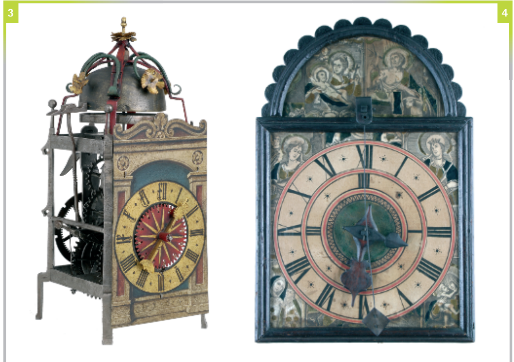
Abbildungen 3 bis 8

sehen: Uhren aus dem 16. und 17. Jahrhundert haben lediglich einen Stundenzeiger, oft ist die Skala aber so eingeteilt, dass auch die halben und die viertel Stunden abgelesen werden können (Abbildung 3).