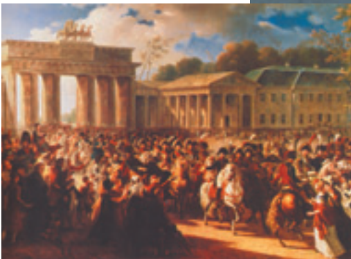
Abbildung 3 Das Brandenburger Tor, 1788–1791 im frühklassischen Stil erbaut, diente als Kulisse vieler geschichtsträchtiger Ereignisse, so auch beim Einzug des siegreichen Napoleon (1769–1821) in Berlin am 27.10.1806.

sion sollte einen Vorschlag für die organisatorische und inhaltliche Ausrichtung der weiteren Gedenkstättenarbeit erarbeiten. Es wurde dabei vorgeschlagen, drei »Aufarbeitungsschwerpunkte« zu bilden: 1. »Herrschaft – Gesell-