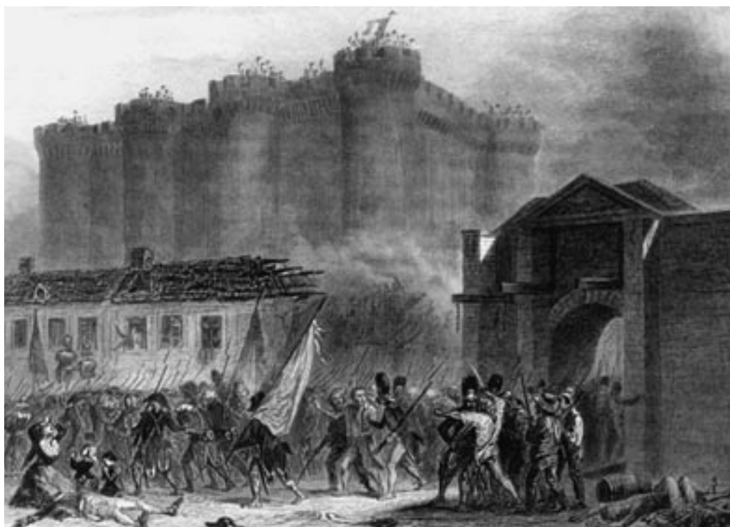
Abbildung 1 Der Sturm auf die Bastille im Jahre 1789 gilt als ein signifikantes Geschichtszeichen, weil er nicht nur als Symbol der Französischen Revolution gilt, sondern auch für den Drang des Menschen nach Freiheit und Gerechtigkeit angesehen werden kann.

entwurf arbeitete, entwickelte die Regierung Kohl einen Fahrplan für den Anschluss der DDR. Am Runden Tisch saßen sich Vertreter der »alten« und der »neuen Kräfte« mit je 19 Stimmen gegenüber. 8 Bei den Volkskammerwahlen am 18. März 1990 jedoch kommen die neuen Kräfte – ohne die SPD – auf insgesamt 8,6 Prozent der Stimmen; der Runde Tisch tritt nicht mehr zusammen. Die meisten Köpfe der Bürgerrechtsbewegung verschwinden, ähnlich ihrem Idol