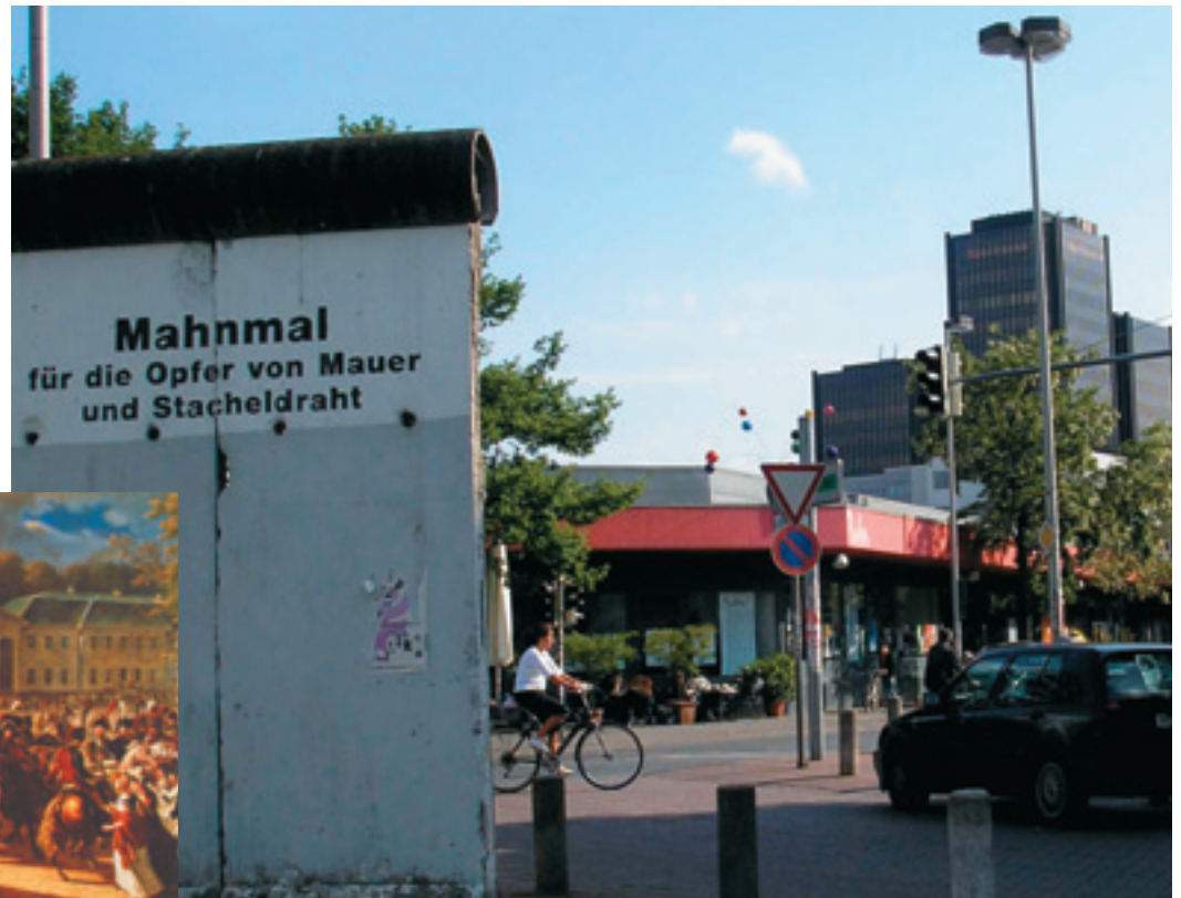
Abbildung 4 Ein Teil der Berliner Mauer steht heute als Mahnmal und Geschichtszeichen am Weissekreuzplatz in Hannover

wir lenken sie nicht. In diesem Sinne schreibt ein großer Antipode Hegels: »Die Kräfte im Spiel der Geschichte gehorchen weder einer Bestimmung noch einer Mechanik, sondern dem Zufall des Kampfes.« 9 Damit ist nicht gesagt, dass in diesem Spiel der Kräfte jederzeit alles gleich wahrscheinlich ist. Der menschengemachte Lauf der Dinge setzt durchaus Zeichen von bleibender Kraft; der Fall der Mauer kann nicht rückgängig gemacht werden. »Weder geschichtsphilosophische Systeme, noch das Lob der Kontingenz – wenn das die Ausgangslage ist, dann bedarf es eines kritischen Umgangs mit ›Geschichtszeichen‹.« 10