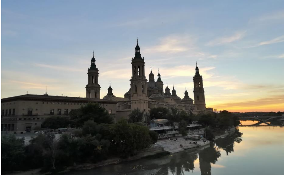
Basilica del Pilar, Zaragoza