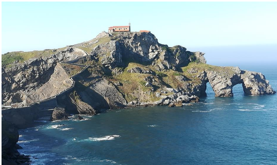
San Juan de Gaztelugatxe (Drehort für Game of Thrones)