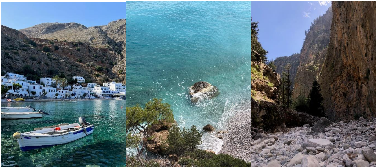
Loutro im Süden von Kreta, Agistri ganz in der Nähe von Athen, die Samaria Schlucht auf Kreta

Bezüglich der Lebenshaltungskosten lässt es sich in Athen gut leben. Die Miete für ein WG-Zimmer liegt in der Regel zwischen 300 und 400€, und auch die Kosten für den öffentlichen Nahverkehr sind sehr gering (ein Ticket für drei Monate kostet etwa 65€). Allerdings sind Supermärkte etwas teurer als in Deutschland.