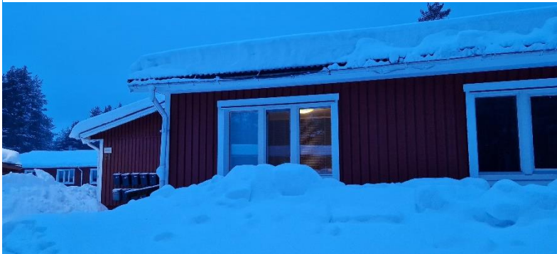
Das Wohnheimzimmer von außen im Schnee versteckt

Im STUK finden auch zweimal die Woche Barabende und ab und an Partyveranstaltungen statt. Im B-Building gibt es die andere Mensa direkt gegenüber vom Service Point. Hier gibt es ebenfalls ein Buffet mit eher asiatisch angehauchtem Essen. So werden beispielsweise Sushi und Dumplings angeboten,