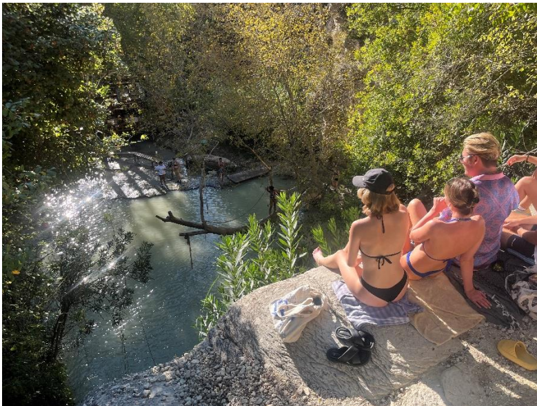
Adonis Waterfalls, Paphos

Ich habe während meines Aufenthaltes unglaublich viele Menschen und Studierende aus aller Welt kennengelernt, ganz besondere Freundschaften geschlossen und mich selber positiv verändert. Ich bin noch aufgeschlossener und offener geworden und vor allen Dingen wesentlich entspannter. Mit meinen neuen Freunden haben wir fast jedes Wochenende gemeinsam ein Auto gemietet und die Insel erkundet. Gerade Paphos und Ayia Napa sind wunderschöne Städte am Strand, wo man Boot fahren, Buggys mieten oder Jetski fahren kann. Wir hatten immer eine super spaßige Zeit und ich werde das erlebte niemals vergessen. Auch wenn es kitschig klingt: die Insel wird immer einen besonderen Platz in meinem Herzen haben! Der nächste Urlaub auf Zypern mit meinen Freunden aus dem Semester ist schon gebucht und ich kann nur jedem raten, ein Auslandssemester auf Zypern zu machen. Bei Fragen stehe ich gerne zur Verfügung.