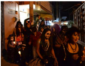
Dia de los muertos