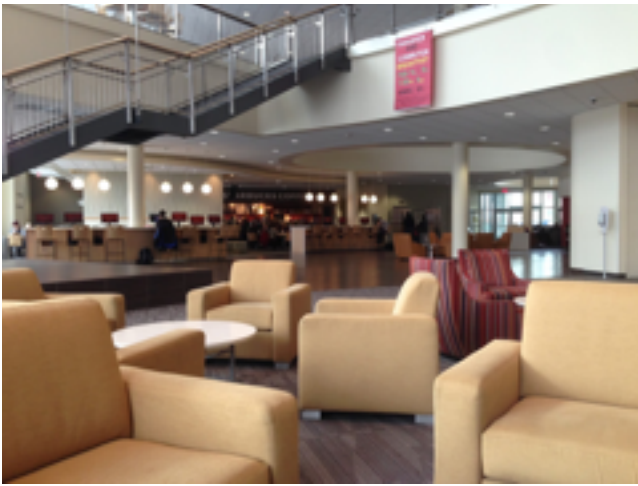
Das „Wohnzimmer“ im Anderson