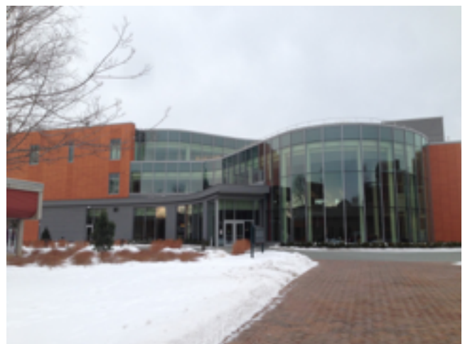
Das Anderson Center