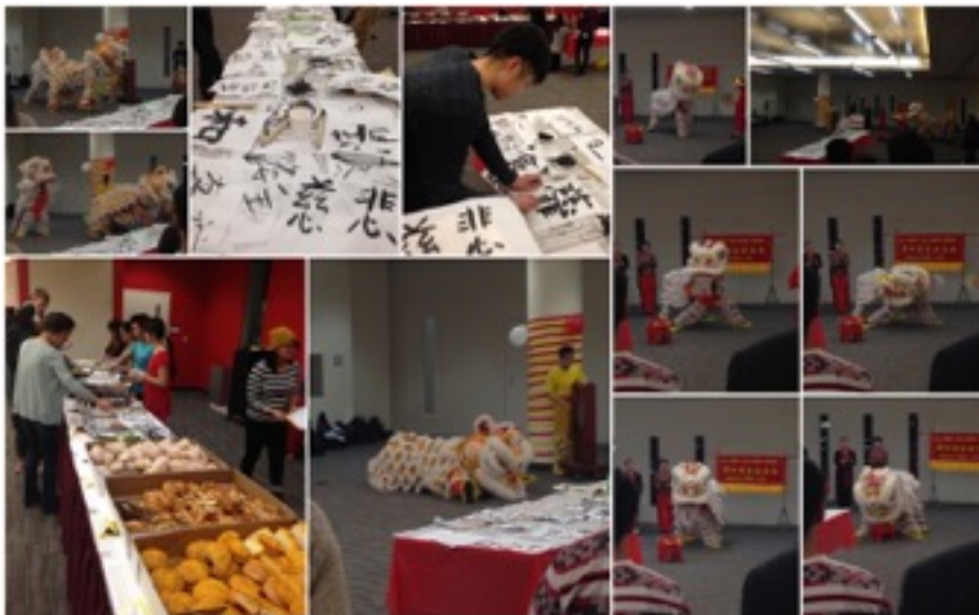
Lunar New Year - organisiert von der Asian Pacific American Coalition (APAC)