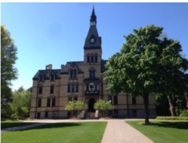
Old Main (das erste Uni-Gebäude von Hamline)

Zu meinen Lebenskosten: Mit den ISEP-Gebühren bezahlt man den Meal Plan, der dann die komplette Verpflegung auf dem Campus einschließt. Man kann zwischen verschiedenen Meal Plans wählen und ich habe mich für einen 160 block und 800$ declining balance Plan entschieden. Jeder „block“ ist eine Mahlzeit in der Mensa (es gab Frühstück/Brunch, Mittag- und Abendessen). Die declining balance (DB genannt) waren auf dem Studentenausweis gespeichert, den man wie eine Kreditkarte auf dem Campus benutzte. Man konnte mit ihnen bei fast jedem Shop auf dem Campus bezahlen (z.B. Starbucks, dem kleinen Uni-Supermarkt, Subway oder einem Imbiss nachdem die Mensa geschlossen hat). Meine Lebenskosten waren also sehr gering!