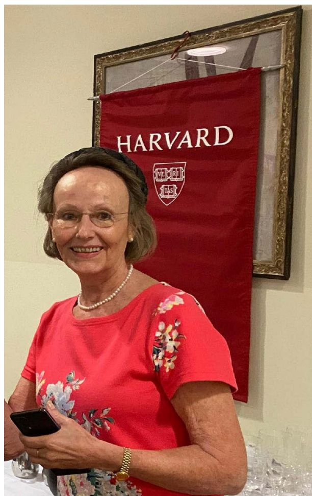
Schließen der offiziellen Sitzung und Einladung zu Wein und Käse