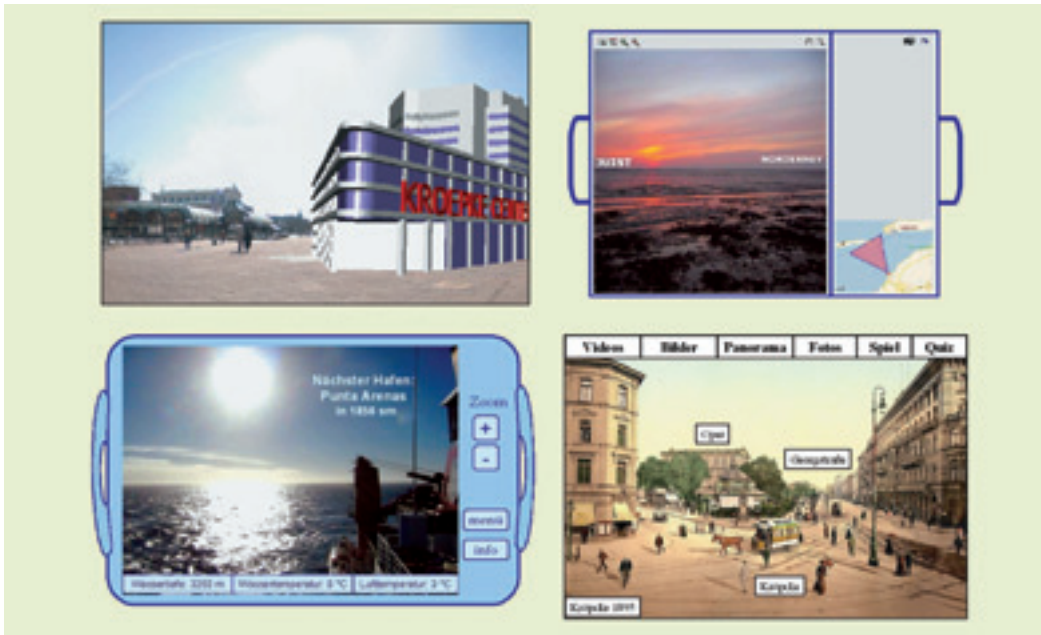
Abbildung 3 Im Brainstorming erarbeitete Szenarien. Augmentierung einer Stadtscene, des Wattenmeers oder des Horizonts (an Bord eines Schiffs), sowie rein virtuelles, historisches Panorama.

fasst werden. Kamera, Bildschirm, Touchscreen und Drehgeber sind an einen Standard-PC angeschlossen, so dass übliche Entwicklungswerkzeuge genutzt werden können.