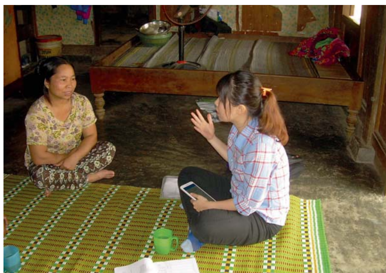
Bis zu vier Stunden kann eine Befragung dauern, wie hier in Vietnam bei Temperaturen von mehr als 30 Grad Celsius.

Was es bedeutet, einen Haushalt über zwei bis vier Stunden auf einer Holzpritsche sitzend unter Bäumen oder einem Blechdach bei Temperaturen von mehr als 30 Grad Celsius zu befragen, weiß Hermann Waibel nur zu gut. Der Fragebogen an die Haushalte ist über 80 Seiten lang, die Interviews erfolgen jeweils vor Ort durch Studierende der lokalen Universitäten, die eigens dazu geschult werden. Erhoben werden Basisdaten wie Haushaltsgröße, Bildungshintergrund und Vermögenswerte, wirtschaftliche Tätigkeit, persönliches Einkommen und verschiedene Schocks wie Überschwemmungen, Dürre, starke Preisschwankungen oder Krankheit und Todesfälle in der Familie. „Eine besondere Rolle spielen Verhaltensparameter wie die Risikoeinstellung und die Frage der Stadt-Land-Beziehung, da insbesondere jüngere Familienmitglieder in die Städte abgewandert sind und von dort einen Teil ihres Einkommens zurückschicken. Deshalb werden auch bei diesen Migranten in Bangkok und Ho Chi Minh Stadt Paneldaten erhoben.“