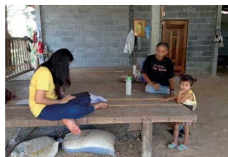
Die Kinder sind immer mit dabei, hier bei einer Befragung in Thailand.

Für die entwicklungsökonomische Forschung in und außerhalb Deutschlands bedeutet das neue DFG-Projekt einen wichtigen Impuls. Der Datensatz steht als öffentliches Gut nationalen und internationalen Forschungseinrichtungen für wissenschaftliche Arbeiten zur Verfügung.